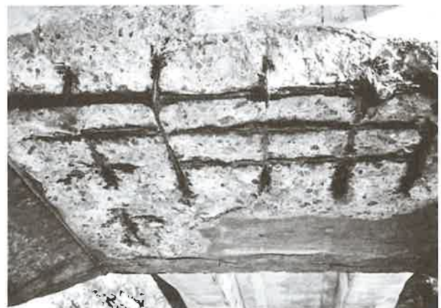
写真 鉄筋コンクリート橋の劣化状況 1)

塩化物イオンがコンクリート内部に浸透してもコンクリート自体は健全です。中性化が生じても