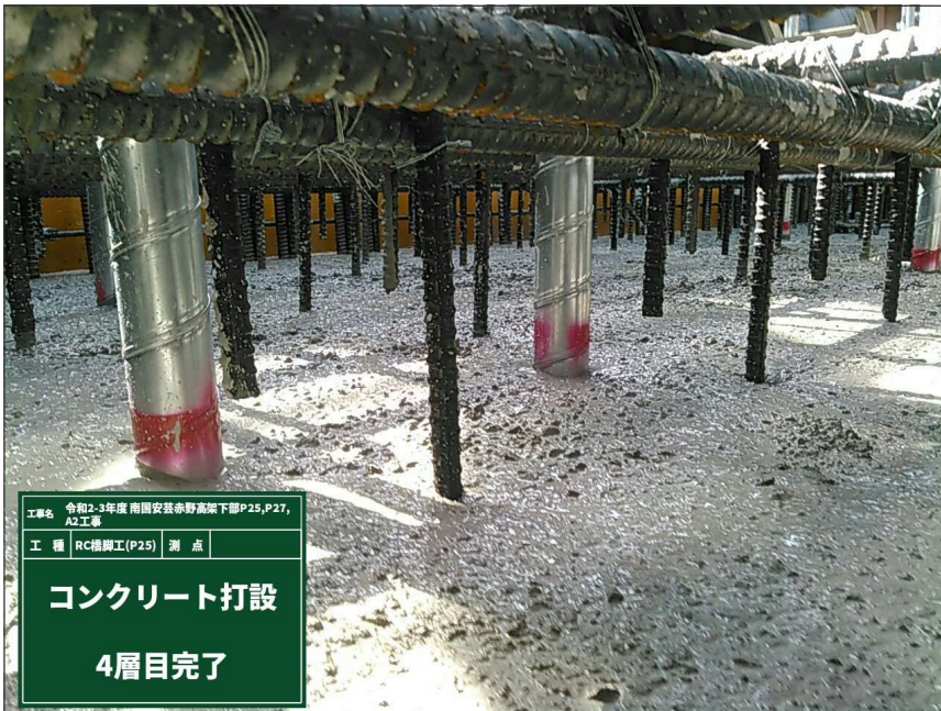
工事名 令和2-3年度 南関東安芸赤野高架下部P25,P27, A2工事 工種 RC橋脚工(P25) 測点 コンクリート打設 4層目完了