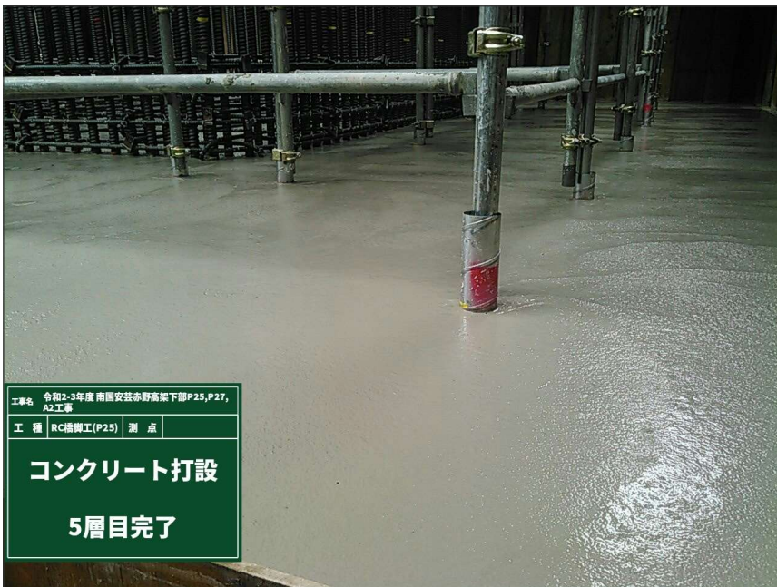
工事名 令和2-3年度 南関東安芸赤野高架下部P25,P27, A2工事 工種 RC橋脚工(P25) 測点 コンクリート打設 5層目完了