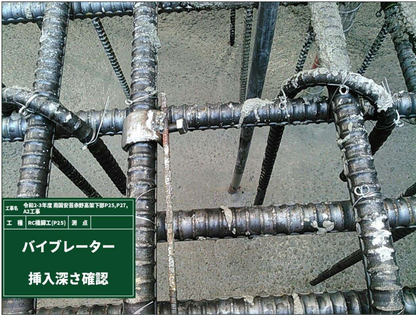
バイブレーター挿入深さ確認 φ50