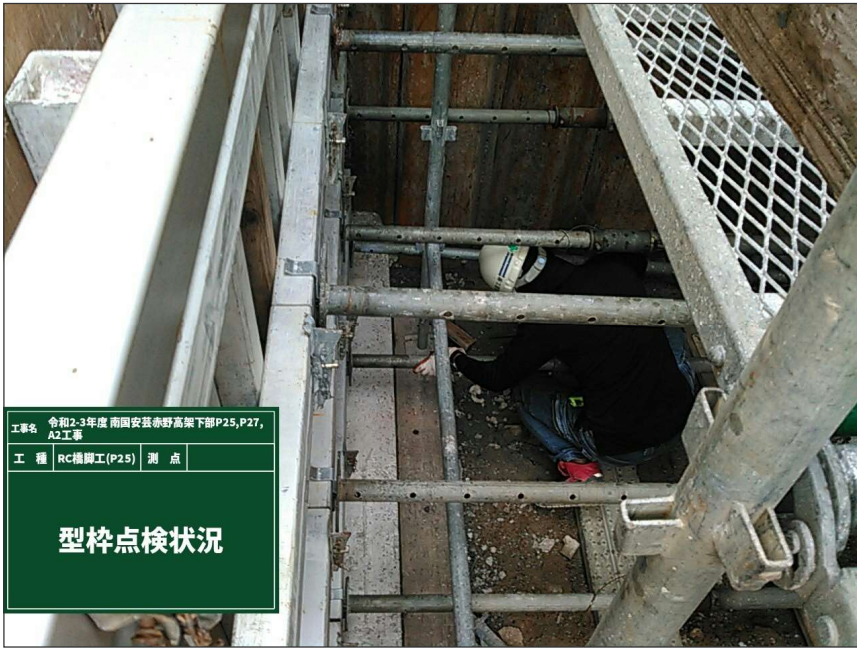
コンクリート打設中 型枠点検状況