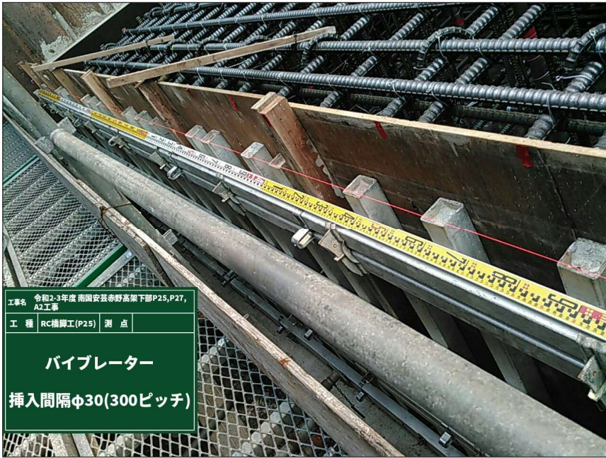
パイプレーター 挿入間隔 φ30(300ピッチ)