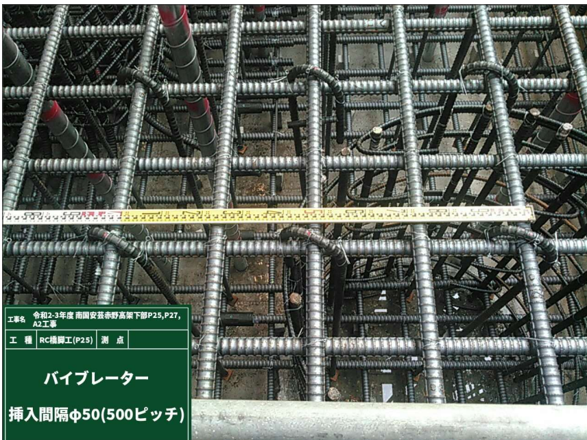
パイプレーター 挿入間隔 φ50(500ピッチ)