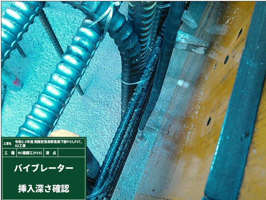
バイブレーター挿入深さ確認 φ30