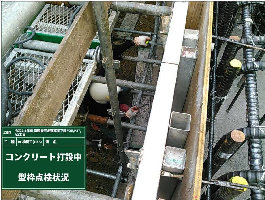
コンクリート打設中 型枠点検状況