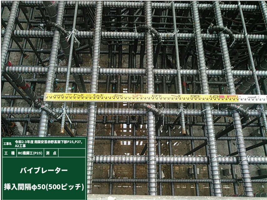
パイプレーター 挿入間隔 φ50(500ピッチ)