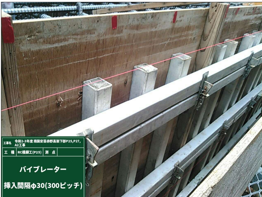
パイプレーター 挿入間隔 φ30(300ピッチ)