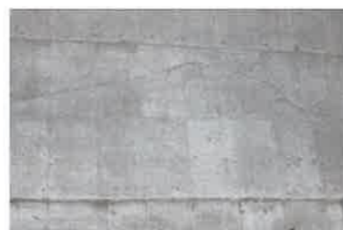
a) コールドジョイントの例

です。コールドジョイントは、打ち重ねる場合に前の層の上に打ち重ねるコンクリートの時間が経過したときのできる一体とならない状態です。沈みひび割れは、ブリーディング水の上昇により沈降が生じた場合に鉄筋の上部で発生するときと、段