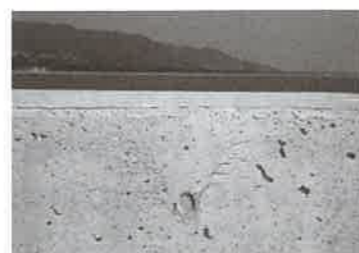
b) 沈みひび割れの例 写真 施工時に生じやすい不具合事例 1)

差のある箇所で、連続して打ち上げた場合に生じるときがあります。表面気泡は斜面の型枠で生じやすく、大きな気泡が不具合とみなされます。