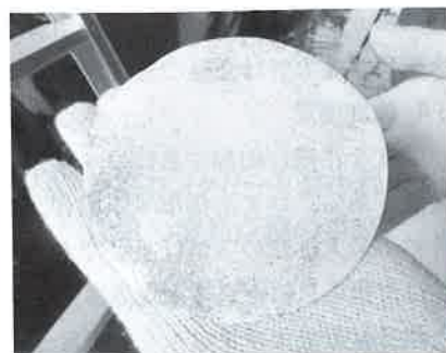
写真3 呈色した中性化していない粉体