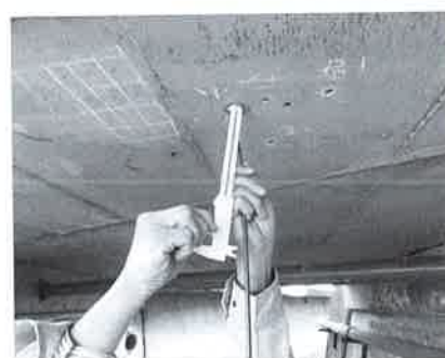
写真4 中性化深さの計測状況