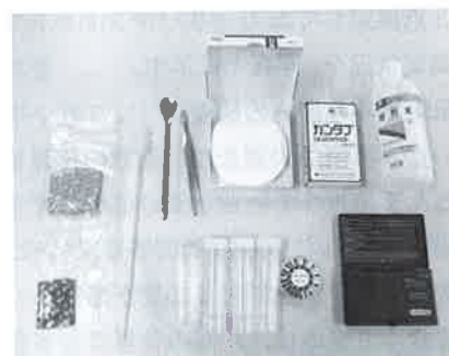
写真5 塩化物イオン量の簡易測定装置

管理が必要となるだろう。国内にある橋梁数は100万橋にも及ぶとされ、国を挙げての延命化策が期待されている。