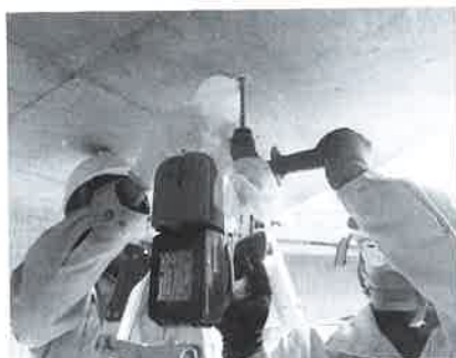
写真2 ドリル法による中性化測定状況

メンテナンスフリーと考えられていたコンクリート構造物が塩害やアルカリシリカ反応によって早期に劣化してしまい、延命化のための補修はできたものの、再劣化を起こす事例も少なくない。床版などの架替えで対応している例も多く、日本国内のインフラストラクチャーを健全に保持するためには、今後は効率的な維持