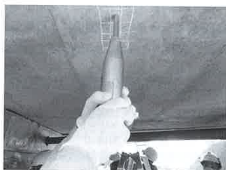
写真1 リバウンドハンマーによる表面反発度の測定状況

透していないことを把握できるため、予防保全の上では必要な調査項目となる。鉄筋の位置までの残りの距離がその後の劣化因子の浸透に影響するため、その時間を推定することで、進展期から加速期に至るまでの時間を推定する。